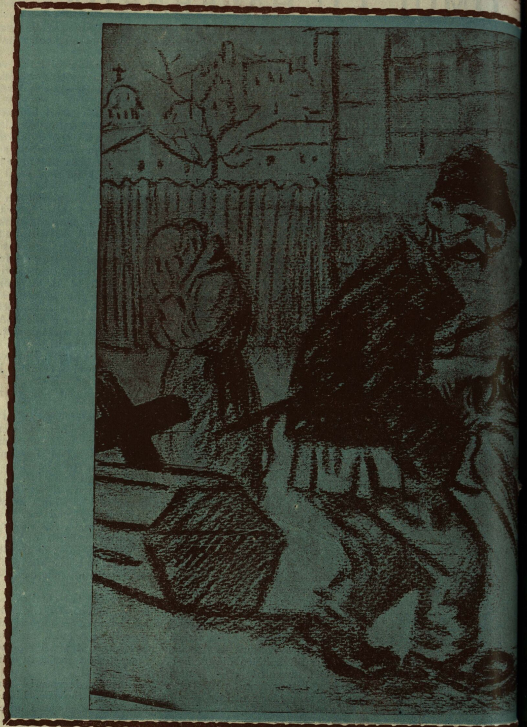
— Bolnavul de la Camera 3 a părăsit patul!