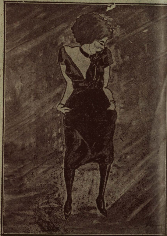
Civilizația orașelor: Nitta Jo.